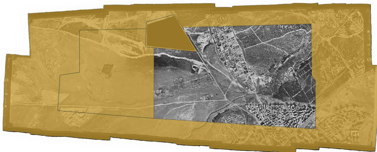
Ámbito de exclusión en color marrón.

ACC_AE_shp_1979.shp: En este SHP están los ámbitos de exclusión de control de calidad por falta de vuelo. Debido a la falta de fotogramas en los extremos y la falta de pasadas superior e inferior. Y el ámbito fuera del límite municipal.